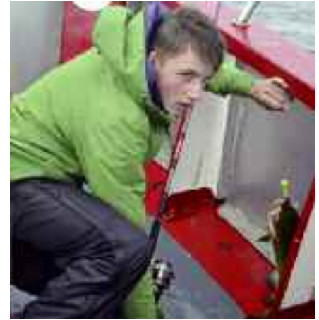
Ob der wohl maßig ist? Ist er, Petri Heil!